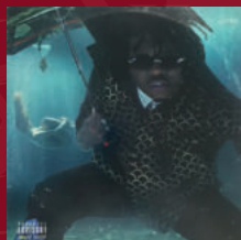
GUNNA Who You Foolin

Kdybys měl vytvořit playlist pro zápas proti SLUNETĚ, jaké tři songy tam MUSÍ být?